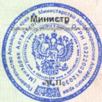
И.В. Долгова (Ф. И. О. уполномоченного лица)

Настоящая лицензия имеет 1 приложение (приложения), являющееся ее неотъемлемой частью на 1 листах